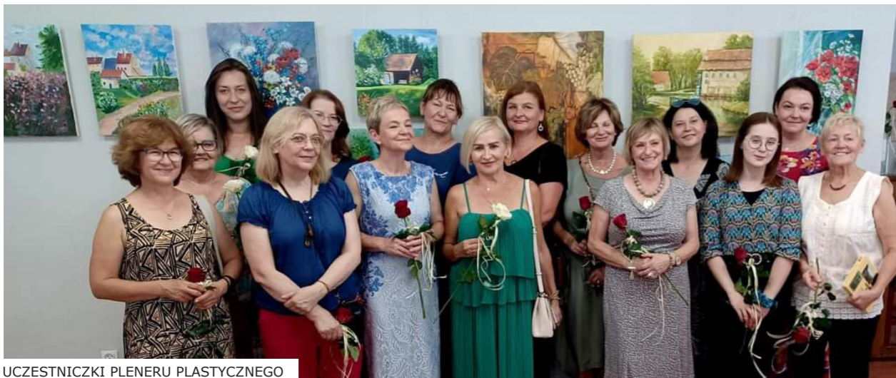
UCZESTNICZKI PLENERU PLASTYCZNEGO

Kiedy w sierpniu czuć w powietrzu zapach terpentyny wiadomo, że w Młynarach odbywa się plener. Po dwóch latach przerwy, z nieukrywaną radością, powróciliśmy do tradycji jego organizacji.