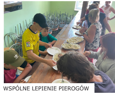
WSPÓLNE LEPIENIE PIEROGÓW

Kwota dofinansowanie: 4 500,00 zł Wkład Własny finansowy: 300,00 zł Praca mieszkańców: 1 500,00 zł