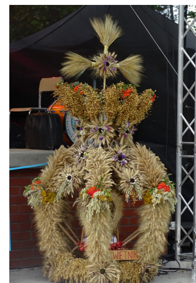
WIENIEC DOŻYNKOWY SOŁECTWA PŁONNE