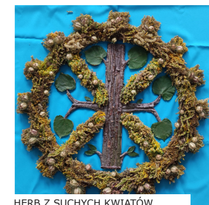
HERB Z SUCHYCH KWIATÓW