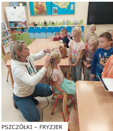
PSZCZÓŁKI – FRYZJER

W przedszkolu mamy 5 oddziałów: „Tygryski”, „Pszczółki”, „Motylki”, „Misie” oraz „Wiewiórki”, do których łącznie uczęszcza 125 dzieci. Niektóre przedsięwzięcia podejmujemy wspólnie, inne realizowane są w poszczególnych oddziałach, ale jedno jest pewne – u nas nie ma czasu na nudę!