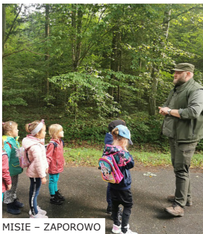
MISIE – ZAPOROWO