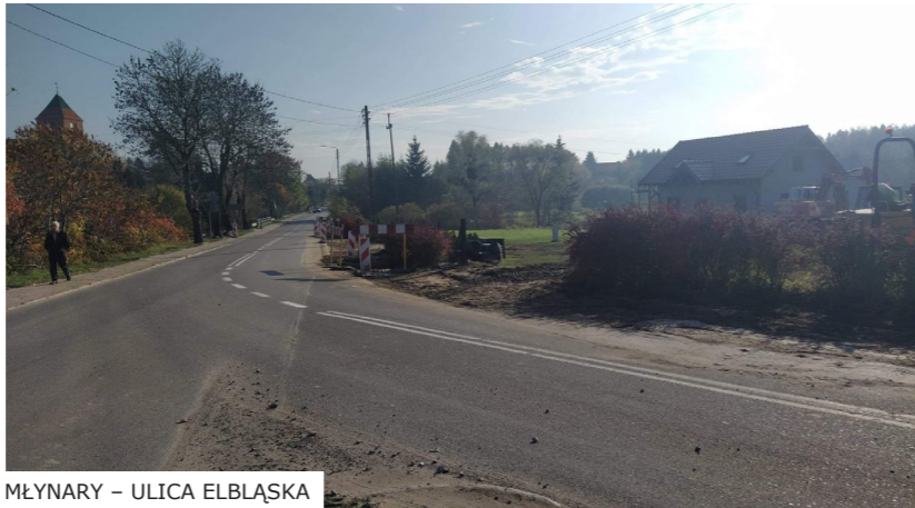
MŁYNARY – ULICA ELBLĄSKA

W trakcie XLVI sesji Rady Miejskiej w Młynarach odbyła się debata o stanie dróg wojewódzkich, powiatowych i gminnych położonych na terenie Gminy Młynary.