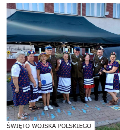
ŚWIĘTO WOJSKA POLSKIEGO

nych na terenie naszego miasta. Dzień Dziecka był również świetną okazją do uczczenia tego dnia słodkimi wypiekami oraz drobnymi upominkami, które panie przygotowały dzieciom.