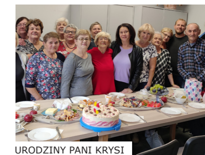
URODZINY PANI KRYSI