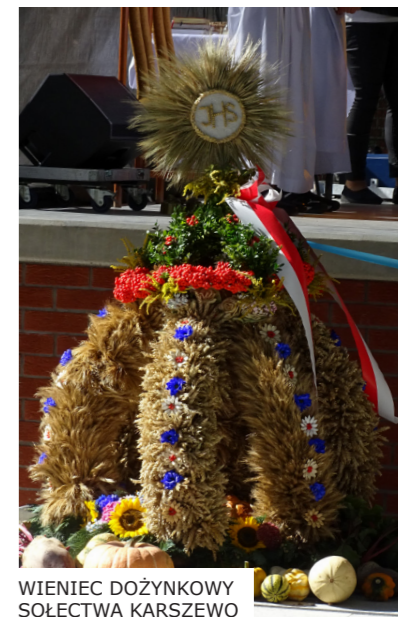
WIENIEC DOŻYNKOWY SOŁECTWA KARSZEWO