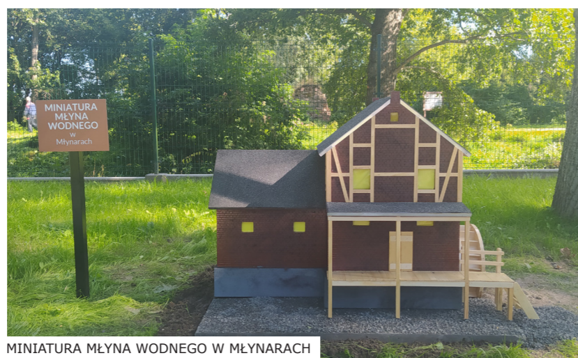
MINIATURA MŁYNA WODNEGO W MŁYNARACH