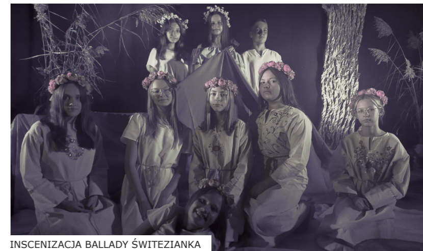
INSCENIZACJA BALLADY ŚWITEZIANKA

Wzorem lat ubiegłych Biblioteka Publiczna w Młynarach zgłosiła swój udział w Narodowym Czytaniu. W tym roku dołączyliśmy wraz ze Szkołą Podstawową w Młynarach do akcji z nieukrywaną radością. Wybór lektury pozwolił nam podjąć teatralne wyzwanie. W piątkowy wieczór na naszej scenie działy się cuda. Było nastrojowo, tajemniczo, nawet trochę groźnie... a to za sprawą pięknej inscenizacji ballady „Świtezianka” przygotowanej przez uczniów Szkoły Podstawowej w Młynarach. Młodzież zaserwowała nam prawdziwą ucztę teatralną. Całość dopełniła nastrojowa muzyka, scenografia i gra świateł. Widzowie nagrodzili ten krótki spektakl gromkimi brawami.