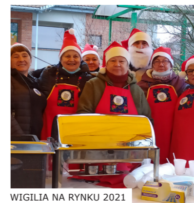
WIGILIA NA RYNKU 2021

Działalność Koła to nie tylko gotowanie i pieczenie, ale też organizacja wycieczek, warsztatów kulinarnych, wieczorków i spotkań przy kawie i słodkościach. W ubiegłym roku Koło włączyło się w akcję bożonarodzeniową „Pacuszka dla Maluszka”. Zebrane artykuły dla maluszków, zostały przekazane dzieciom z niepełnosprawnościami w Elblągu. Uczestniczki Koła, akcję uznały za udaną, bo nie przypuszczały, że odzew będzie tak duży.