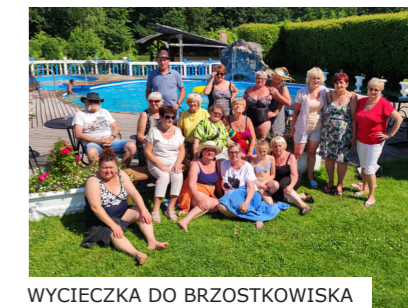
WYCIECZKA DO BRZOSTKOWISKA