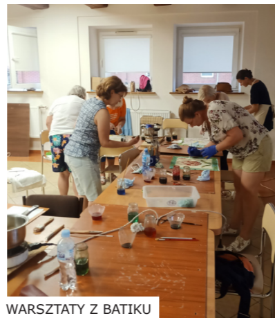
WARSZTATY Z BATIKU