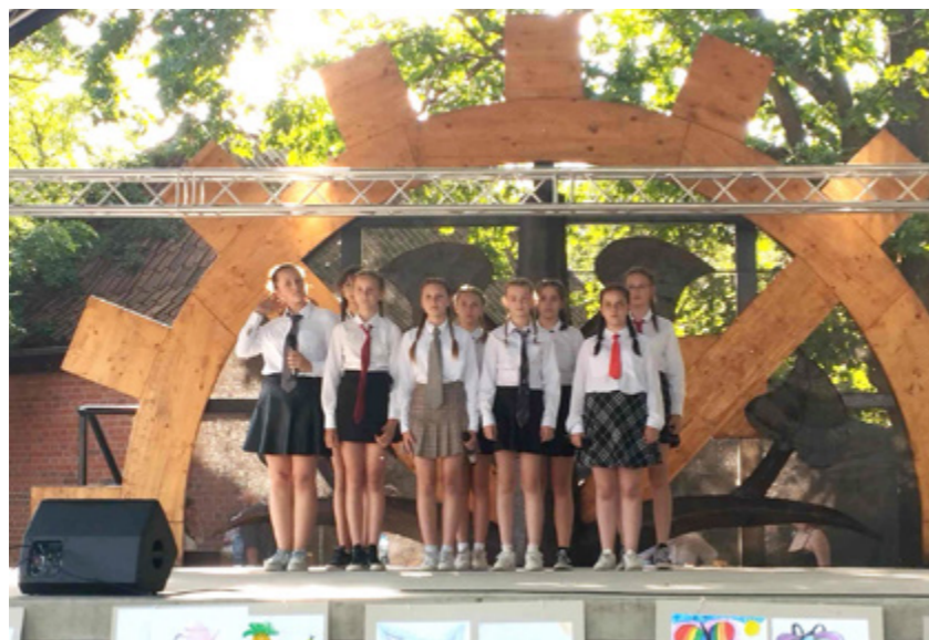
ŚREDNIANKI - KONCERT WITAJCIE W NASZEJ BAJCE