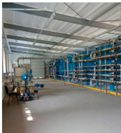
SUW po modernizacji