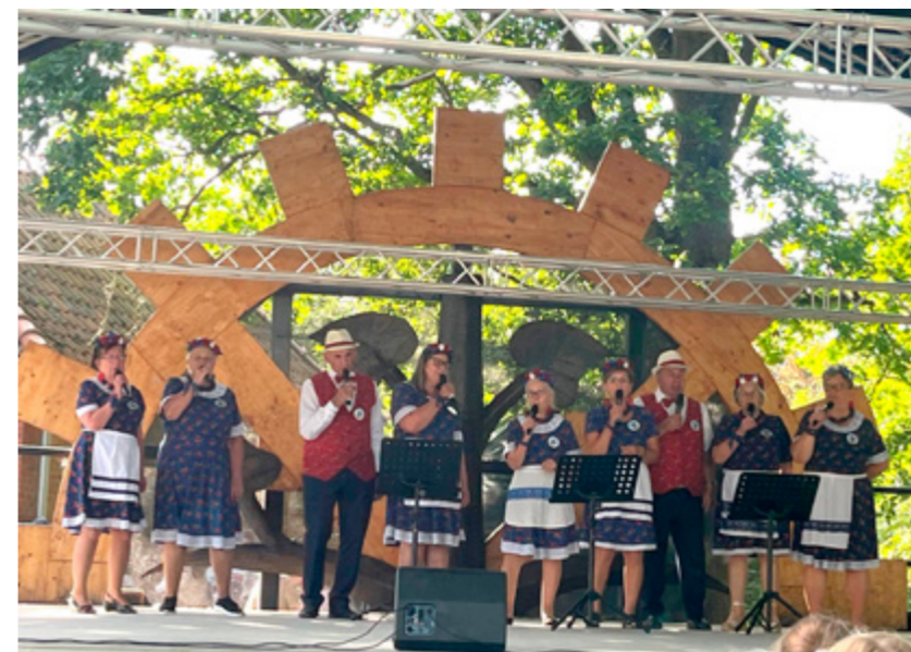
KOŁO GOSPODYŃ W MŁYNARACH

Przy Ośrodku Kultury w Młynarach działają cztery grupy wokalne: wokalne (dzieci 5-8 lat, dzieci 9-12 lat, młodzież i Koło Gospodyń w Młynarach) prowadzone są przez panią Maję Panicz- instruktora wokalnego. Grupy taneczne: