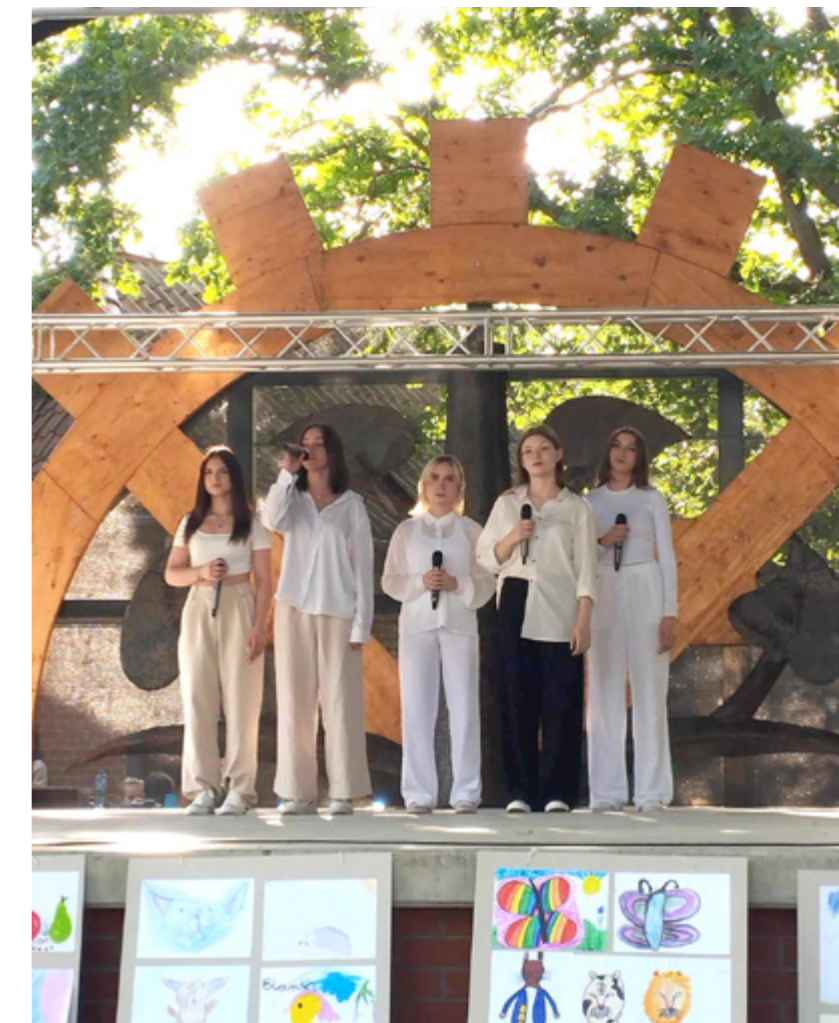
DZIEWCZYNY - KONCERT WITAJCIE W NASZEJ BAJCE

Wakacyjna atmosfera udzieliła się mieszkańcom, którzy chętnie uczest-