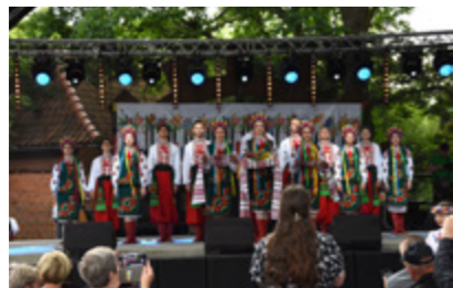
ZESPÓŁ PIESNI I TAŃCA DUMKA

Ogólnopolski Przegląd Kultury Mniejszości Narodowych - INTEGRACJE to inicjatywa, która od ponad trzydziestu lat upowszechnia kulturę mniejszości narodowych i integruje wielokulturowe społeczeństwa naszego regionu. W tym roku uczestnicy i widzowie przeglądu spotkali się po raz 32. Wypełniona koncertami, stoiskami z regionalnymi potrawami i rękodziełem oraz atrakcjami dla najmłodszych impreza odbyła się w młynarskim Amfiteatrze 15 czerwca. Organizatorami tego wydarzenia był Ośrodek Kultury w Młynarach i Stowarzyszenie Przyjaciół Młynar.