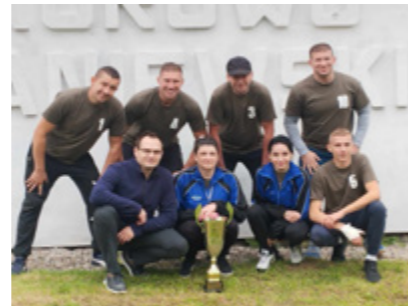
ZWYCIĘSKA DRUŻYNA KUROWO BRANIEWSKIE - TURNIEJ SOŁECTW 2024

W tym roku puchar ponownie powędrował do sołectwa Kurowo Braniewskie. To właśnie zwycięzcy w przyszłym roku będą gospodarzami Turnieju Sołectw Gminy Młynary.