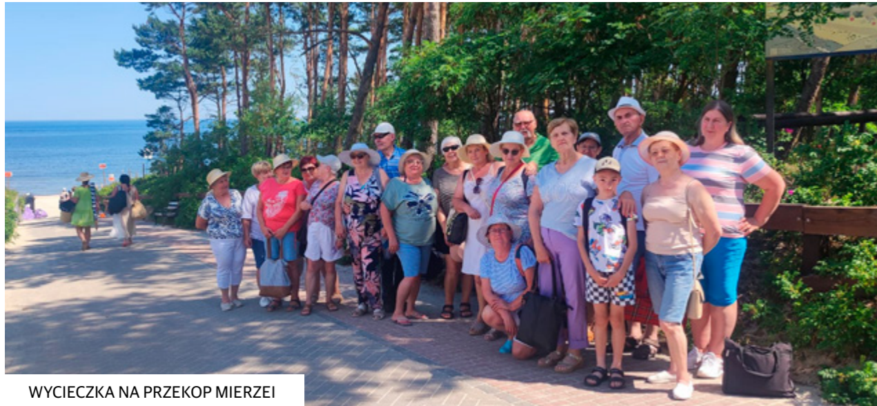
WYCIEZKA NA PRZEKOP MIERZEI