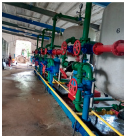
SUW przed modernizacją