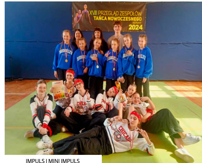
IMPULS I MINI IMPULS

29 kwietnia obchodzony jest Międzynarodowy Dzień Tańca. W Młynarach to święto celebrowane było już w sobotę 27 kwietnia, a to za sprawą rzeszy tancerzy, którzy przybyli na XVII Przegląd Zespołów Tańca Nowoczesnego.