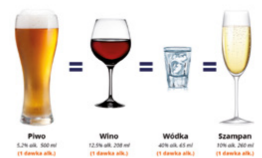
Grafika przedstawia 1 dawkę alkoholu = 10 g czystego alkoholu.

Głównym czynnikiem odpowiedzialnym za rakotwórczy efekt spożycia alkoholu jest aldehyd octowy, który jest toksycznym produktem trawienia etanolu. Aldehyd octowy uszkadza kod DNA (zmniejsza znacznie jego stabilność) i upośledza naturalną zdolność komórki do naprawiania tych uszkodzeń. Wpływa również na powstawanie stanów zapalnych w organizmie. W efekcie zwiększa