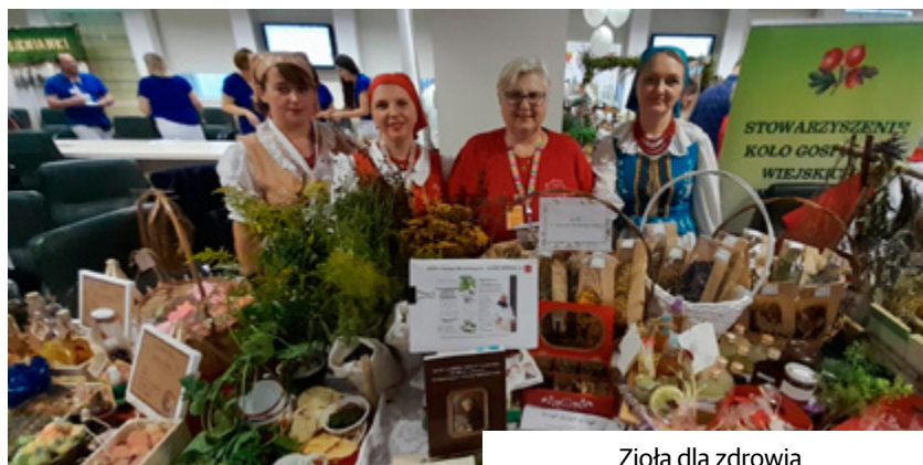
Zioła dla zdrowia