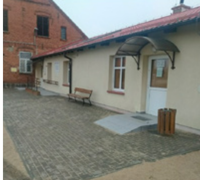
Utwardzenie terenu przy świetlicy wiejskiej w Błudowie

Fundusz sołecki to część budżetu gminy, która jest przeznaczona na realizację potrzeb mieszkańców sołectw. Środki te są wydzielane z budżetu gminy w celu wspierania działań zgodnych z zadaniami własnymi gminy, które mają na celu poprawę jakości życia lokalnej społeczności. To narzędzie pozwala mieszkańcom sołectw aktywnie uczestniczyć w decydowaniu o inwestycjach i projektach realizowanych na ich terenie.