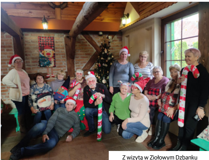
Z wizytą w Ziołowym Dzbanku

gotowywaliśmy pyszne ciasteczka, które później ze smakiem zjedliśmy.