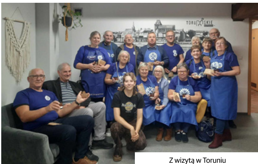
Z wizytą w Toruniu

Zapraszamy do śledzenia naszych przyszłych inicjatyw i wspólnego angażowania się w życie naszego Koła!