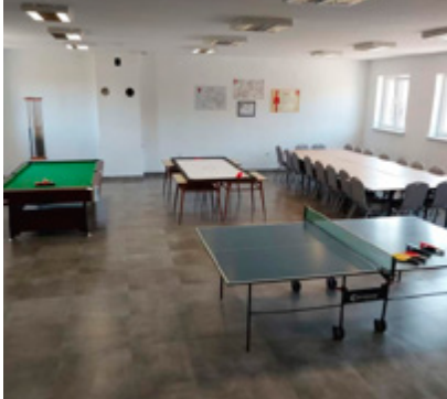
Świetlica wejska Sąpy