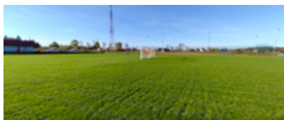
Płyta boiska stadionu miejskiego

W 2025 roku czeka nas kontynuacja zapoczątkowanych już inwestycji oraz szereg nowych.