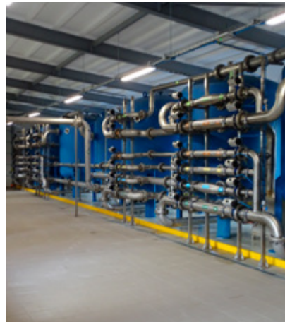
Stacja Uzdatniania Wody