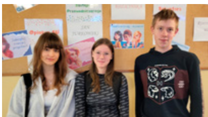
Finałiści konkursów przedmiotowych organizowanych przez KO w Olsztynie