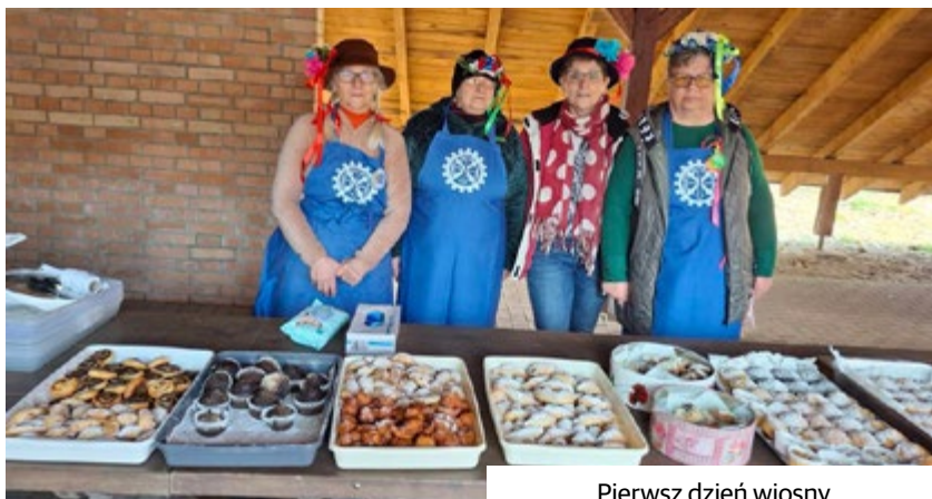
Pierwsz dzień wiosny