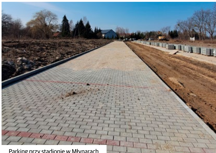
Parking przy stadionie w Młynarach