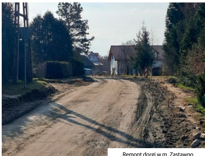
Remont drogi w m. Zastawno