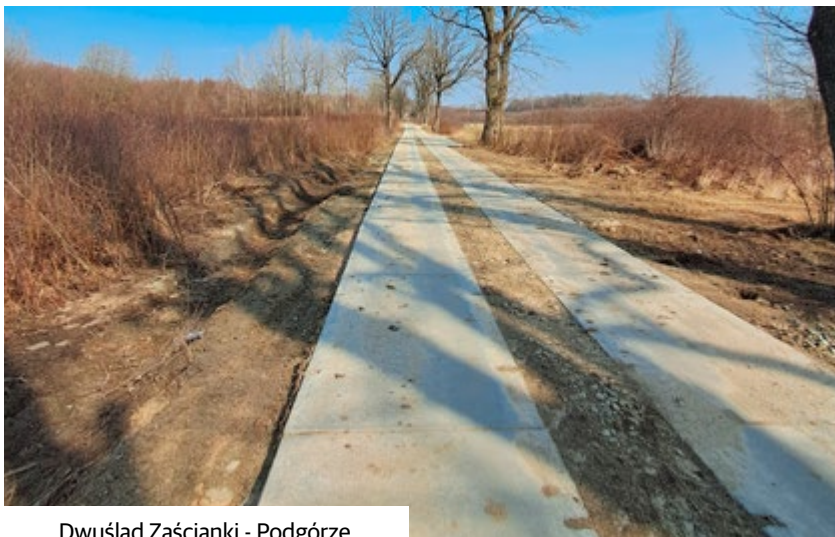
Dwuślad Zaścianki - Podgórze

Pierwszy kwartał już za nami, co oznacza, że realizacja inwestycji na terenie Gminy Młynary trwa w najlepszej formie!