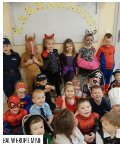
BAL W GRUPIE MISIE