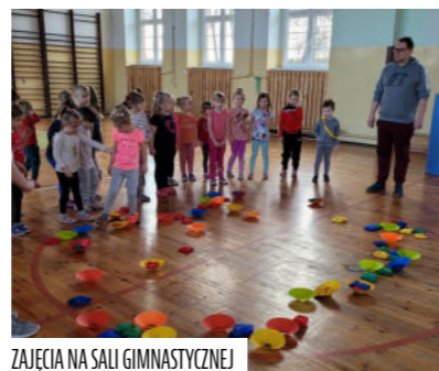
ZAJĘCIA NA SALI GIMNASTYCZNEJ