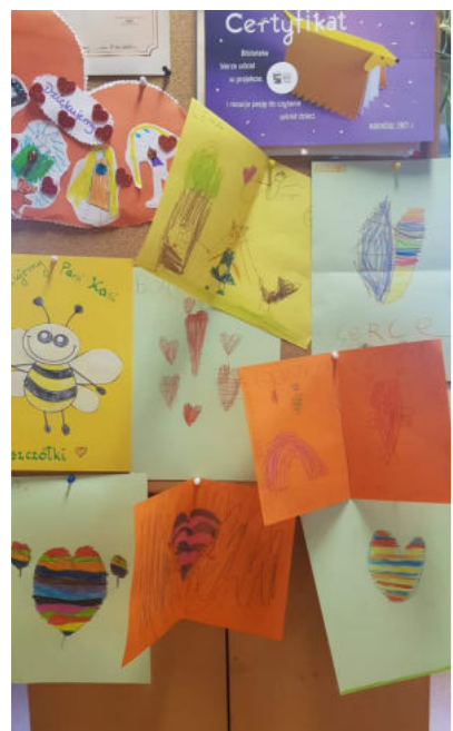
PODZIĘKOWANIA CZYTELNIKÓW ZA CIEKAWĄ LEKCJĘ BIBLIOTECZNA

„CZYTANIE ROZWIJA ROZUM MŁODZIEŻY, ODMŁADZA CHARAKTER STARCA, USZLACHTNIA W CHWILACH POMYŚLNOŚCI, DAJE POMOC I POCIESZENIE W PRZECIWNOCIACH” — Ciceron