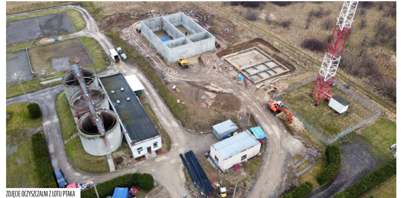
ZDJĘCIE OCZYSZCZALNI Z LOTU PTAKA

Nie można pominąć również aktualnie prowadzonej inwestycji, modernizacji oczyszczalni ścieków w Młynarach. Prace prowadzone są „pełną parą”, planowany termin zakończenia w czerwcu br. Na następnej stronie przedstawiamy fotografie i rzut z lotu ptaka, które oddają ogrom wykonanej pracy.