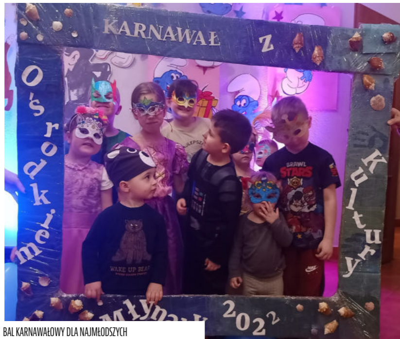
BAL KARNAWAŁOWY DLA NAJMŁODSZYCH

Podsumowaniem ferii był Maraton Filmowy dla dzieci i młodzieży oraz sobotni Bal Karnawałowy dla Najmłodszych. To był prawdziwy zlot