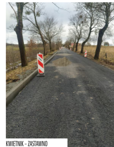
KWIETNIK – ZASTAWNO