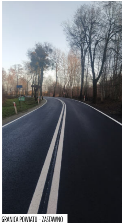
GRANICA POWIATU – ZASTAWNO

gminną Sąpy-Warszewo, wzmocnienie konstrukcji nawierzchni jezdni w msc. Sąpy. Aby przebudowa drogi mogła dojść do skutku Burmistrz Gminy Młynary podjęła wiele starań , a gmina udzieliła pomocy finansowej Samorządowi Województwa Warmińsko Mazurskiego w wysokości 160 000,00 zł.