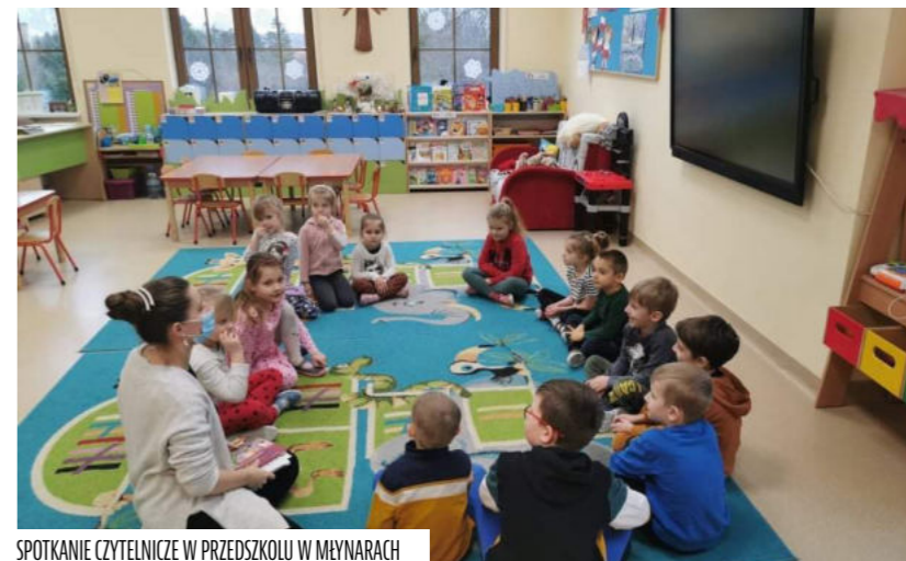
SPOTKANIE CZYTELNICZE W PRZEDSZKOLU W MŁYNARACH

Biblioteka jest miejscem przyjaznej przestrzeni dla Najmłodszych, którzy w gronie naszych użytkowników stanowią grupę szczególną, bo wymagającą bardziej indywidualnego podejścia i zainteresowania. Aktywny kontakt z książką i biblioteką pozwala najmłodszym wkroczyć odważnie w świat literatury oraz kształtuje zanikające w dzisiejszym świecie nawyki czytelnictwa. Dlatego tak ważny w naszej działalności jest kontakt z najmłodszym Czytelnikiem. Odzwierciedleniem tych działań jest wciąż wzbogacana oferta czytelnictwa skierowana również do dzieci, które jeszcze nie potrafią czytać, a także promocja czytelnictwa. Od zeszłego roku realizujemy ogólnopolski program „Mała książka, wielki człowiek”. W ramach tej