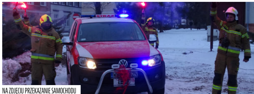
NA ZDJĘCIU PRZEKAZANIE SAMOCHODU

Młynarska OSP służy pomocą wszystkim, którzy tego potrzebują. Angażuje się również w uroczystości oraz akcje odbywające się na terenie Naszej Gminy. Mimo pandemii jaka opanowała