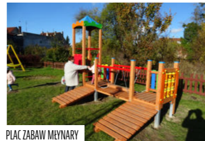
PLAC ZABAW MŁYNARY

z funduszu sołeckiego przeznaczą na remonty dróg gminnych. Są to Ojcowa Wola, Kraskowo, Mikołajki, Sokolnik, Stare Monasterzysko. Większość dróg w gminie Młynary to drogi szutrowe.