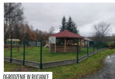
OGRODZENIE W RUCIANCE