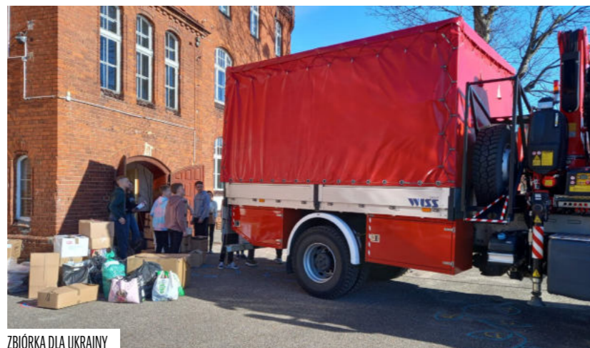
ZBIÓRKA DLA UKRAINY